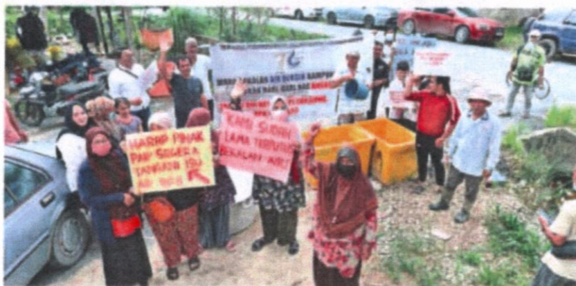
PENDUDUK kampung mengadakan demonstrasi aman mereka agar masalah bekalan air bersih sejak sekian lama dapat ditatasi segera di Kampung Kasing di Rompin semalam.

"Kami menderita, sampai tidak dapat sembahyang, itu be-